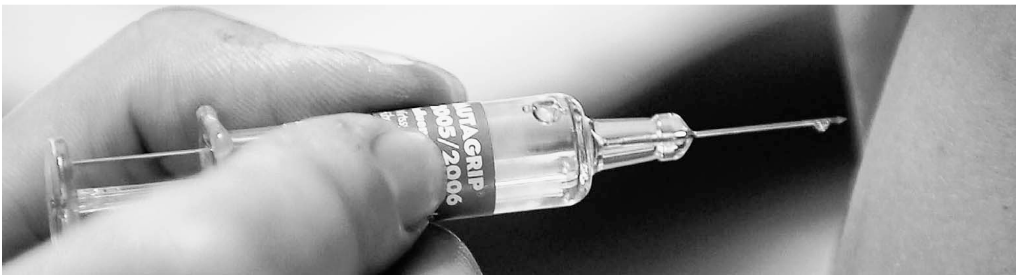
SPRITZE. Die nächste Grippezeit kommt bestimmt und allenthalben wird nun wieder die Impfung angepriesen. Das Bundesamt für Gesundheit (BAG) empfiehlt Risikopersonen die jährliche Grippeimpfung, um schwere Erkrankungen, Spitalaufenthalte und Todesfälle zu vermeiden. Zu den Risikopersonen gehören Menschen über 65 Jahre, solche mit chronischen Leiden wie etwa der Atemorgane oder mit Herz-Kreislauf-Krankheiten sowie jene mit einer Immunschwäche. Es gibt aber auch kritische Stimmen. So wird moniert, dass bei älteren oder kranken Menschen das Abwehrsystem weiter geschwächt werde. Und laut einer Umfrage des BAG vom Herbst 2003 liessen sich rund drei Viertel des Medizinalpersonals nicht impfen – die meisten, weil sie die Wirksamkeit nicht überzeugte.